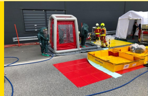
Austritt von Ammoniak bei einer Kühlmaschine in einer Fabrikhalle