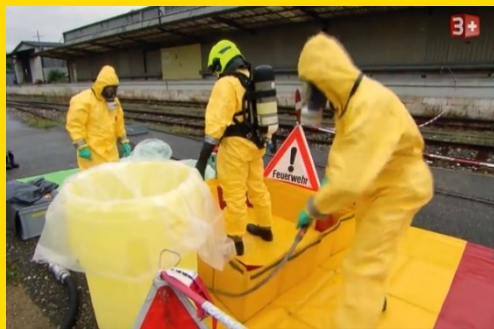
Dekontamination nach Chemieereignis