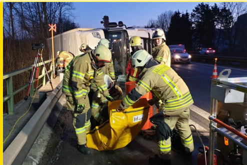
Gefahrengut-Unfall auf der Autobahn A2