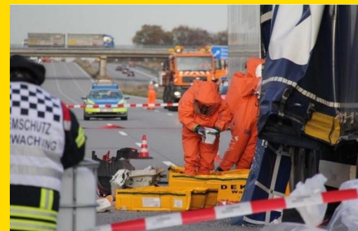
Austritt von Phosphor nach Unfall