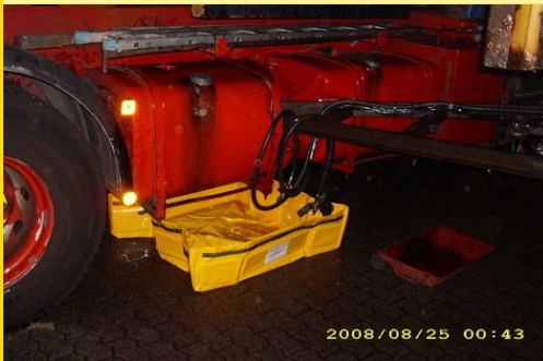
Auslaufendes Dieselöl aus LKW-Tank